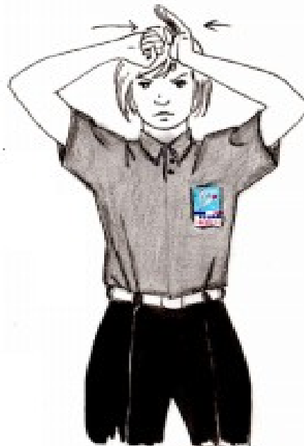
COUP TROP PUISSANT