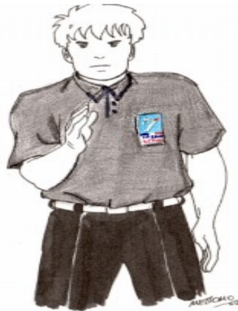
En Garde / STOP