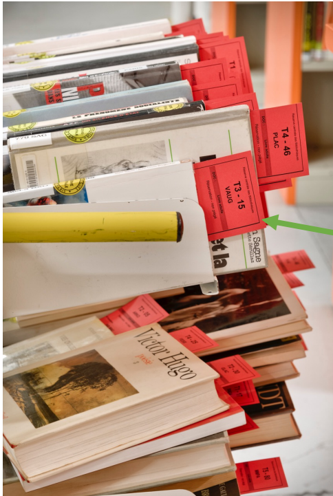
Une fiche rouge dans un livre