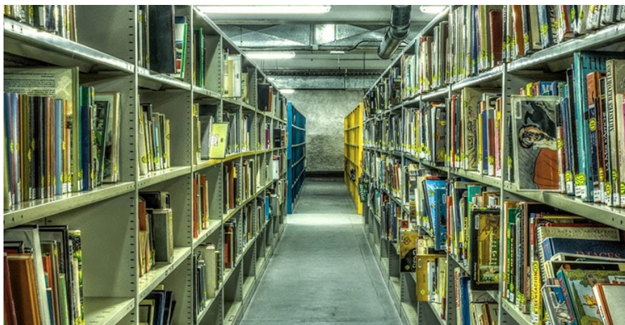
Une réserve de livres