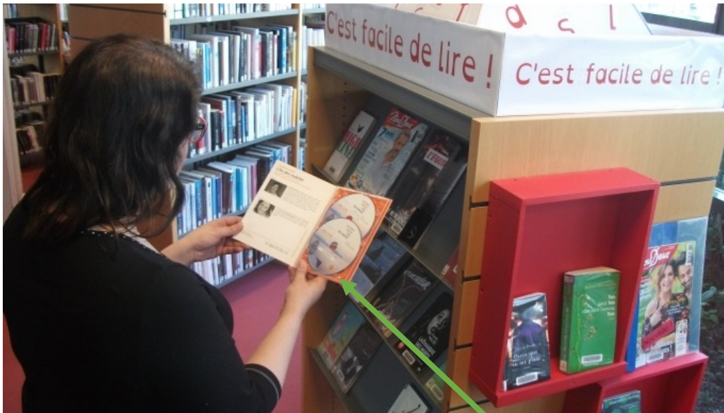
Un livre audio avec CD