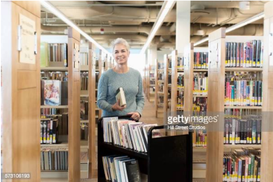
Une documentaliste qui range des livres