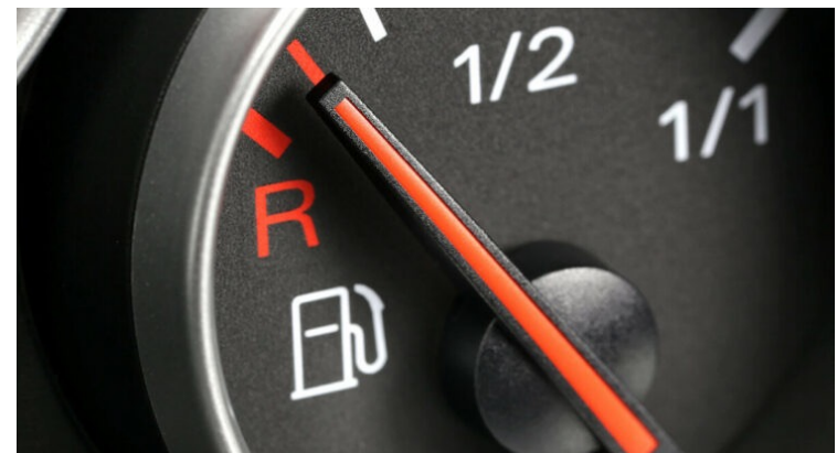
Être sur la réserve (d'essence)