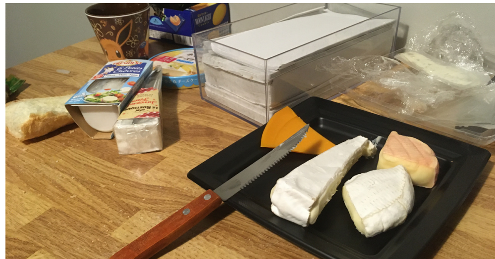
Une culture culinaire