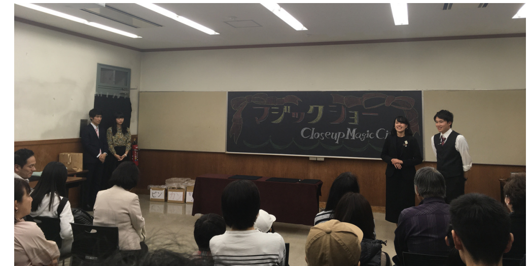
Des lieux d'apprentissage