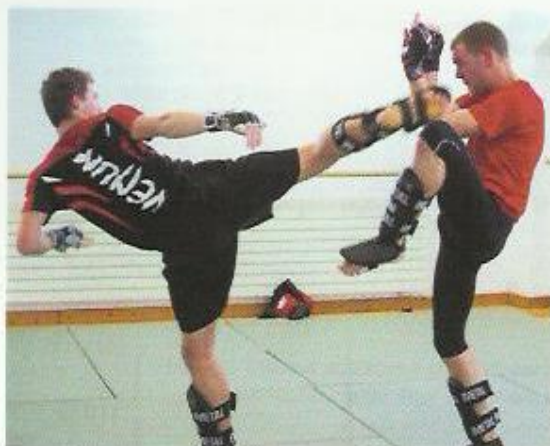
1. High-kick jambe arrière défendu par blocage

La pratique universitaire a montré que les obstacles liés à l'éthique et à